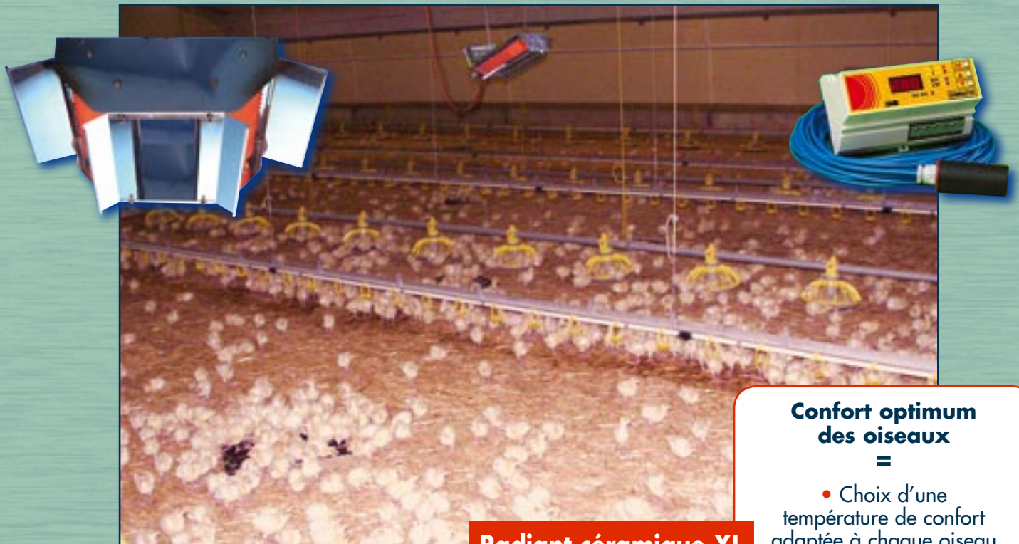
Radiant céramique XL

Pour poulailler à plafond bas ou de grande largeur